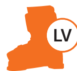
LOW VOLUME 98 mm

Troveremo, quindi, modelli LV (stretti - da 93 a 98mm), MV (medi - da 99 a 100mm) e HV (ampi - 103mm).